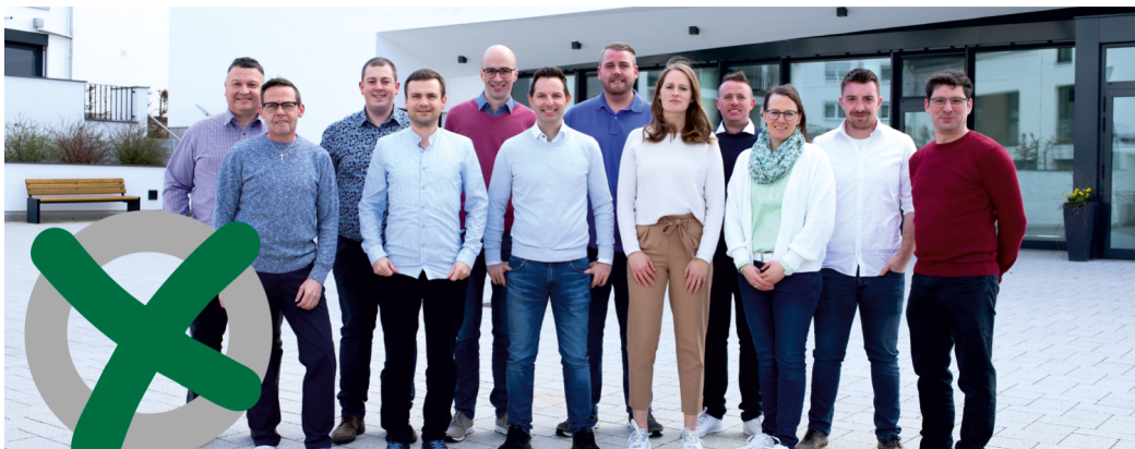
Ihre Kandidaten, für Ihre ganz persönlichen Belange, die dafür sorgen, dass BERNSTADT LEBT!