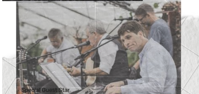
Special Guest Star